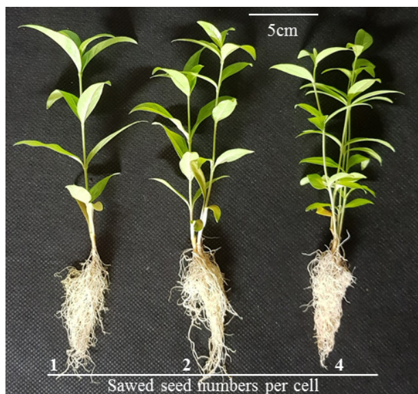
Fig. 3. Growth of Amsonia elliptica (Thunb.) Roem. & Schult. after cultivation according to sowed seed numbers per cell.

으나 1000 mg/L에서 유의하게 두꺼워졌다. 한편 엽록소함량은 추비의 농도가 증가함에 따라 감소하는 경향으로 생육과는 반대되는 결과가 나타났다. Hyponex 미분은 속효성 식물영양제로 칼륨성분이 풍부하여 식물의 조직을 튼튼하게 하고 병충해, 내한성, 내서성 증진 효과가 있어 식물의 생육을 촉진한다 (Hyponex, 2021). 칼륨은 원형질의 구조 유지와 pH, 삼투압 조절, 세포 내 물질대사를 정상적으로 일어나도록 하며, 기공 개폐, 다양한 효소계를 활성화시켜 식물체 내에서 이동이 잘되어 결핍 시 줄기의 노엽 가장자리에 반점 형태의 증상이 나타나는 것으로 알려져 있다(Marschner, 1995). Kang et al. (2005)의 연구에서 카네이션에 수용성 비료를 처리한 결과 추비의 농도가 증가할수록 생육도 촉진되었다. 또한 파프리카의 경우 양액을 처리할 때 칼륨의 농도와 생육이 적정농도까지는 비례하여 증가하는 것을 확인하였다(Han et al. , 2011). 따라서 정향풀의 생육이 촉진된 결과로 Hyponex 미분 내 칼륨 함량이 높아 세포 내 물질대사와 다양한 효소계의 활성화로 인한 것으로 판단된다.