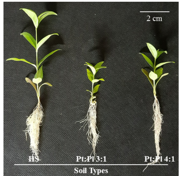
Fig. 2. Growth of Amsonia elliptica (Thunb.) Roem. & Schult. after cultivation according to soil type. HS, horticultural substrate; Pt, peatmoss; Pl, Perlite.

이 가장 큰 72구 트레이에서 가장 우수하였다(Fig. 2). 초장, 경직경 및 엽수는 72구 트레이에서 가장 우수하였고, 다음으로 105구, 128구 순으로 나타났다(Table 1). 엽록소 함량과 마디수는 128구에서 가장 가장 감소하였지만 72구와 105구의 경우 유의적인 차이가 나타나지 않았다. 지상부 및 지하부 생체중은 플러그 셀의 크기가 증가할수록 무게가 증가하는 경향을 보여 72구에서 가장 우수하였다. 이러한 결과는 애호박 육묘 시 플러그 셀의 크기가 커질수록 생육도 증가하여 본 연구의 결과와 일치